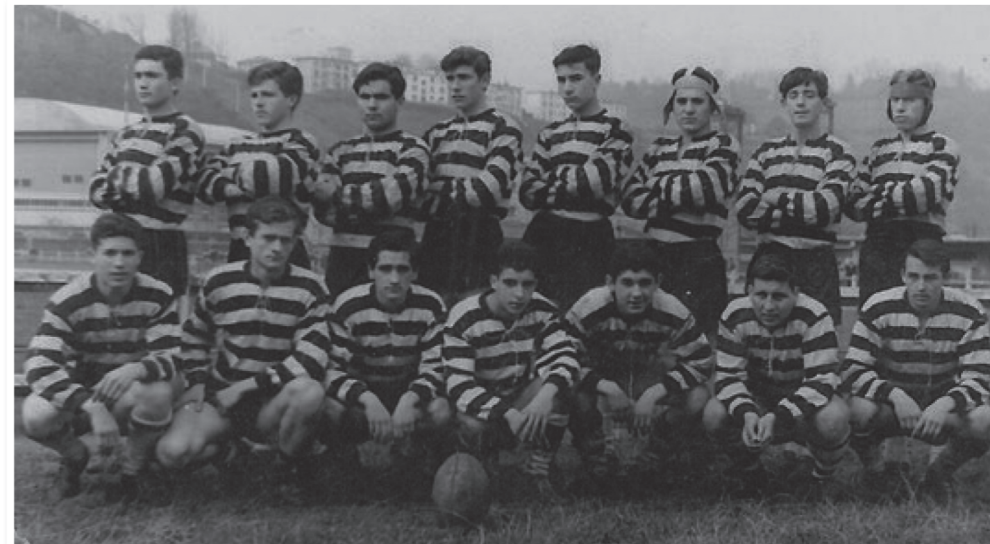
Uno de los primeros partidos jugados por El Salvador fuera de Valladolid. Torneo en San Sebastián, c. 1961.

hicieron a la localidad francesa de Clermont-Ferrand, en pleno corazón de Francia. En 1964 fueron invitados los equipos de las que entonces se conocían como primera y segunda categoría al Challenge Michelin, considerado como el torneo de categorías inferiores más prestigioso de Francia en aquellos momentos.