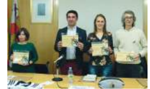
Jornada Deporte Igualdad y Violencia de Género.