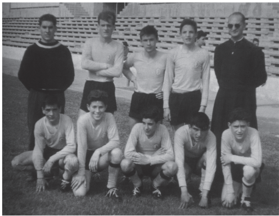
Equipo desplazado al primer Campeonato de España, disputado en Zaragoza.

tel', lo que nos hacía correr y pasar el balón a una enorme velocidad. También, pese a ser pequeños y de poco peso, conseguíamos desestabilizar las fuertes melés francesas contra pronóstico".