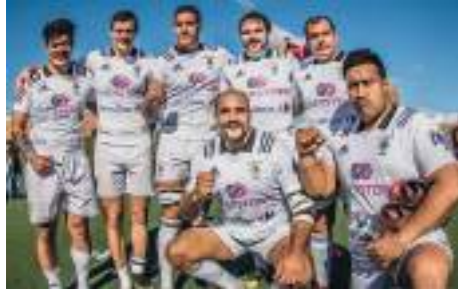
MoBros El Salvador.