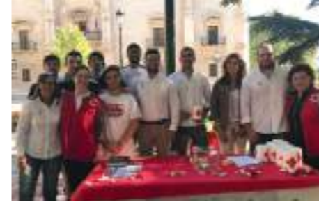
Día de la Banderita.