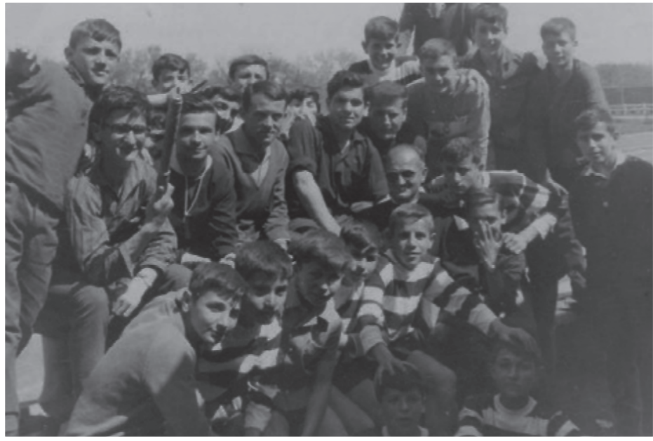
Concentración de jugadores en Valladolid.