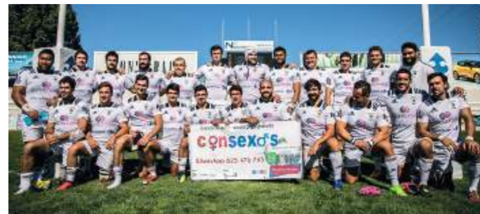
El equipo con la campaña 'Consexos'.