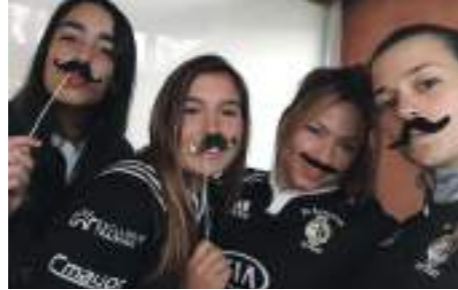
MoSistas El Salvador.